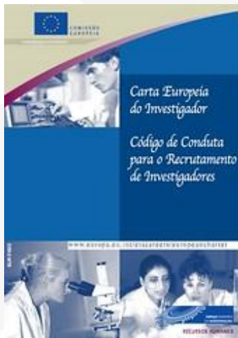
C&C Researcher 2005

2014 Creation of the Permanent Monitoring Group for the implementation, monitoring and evaluation of the Strategic Action Plan