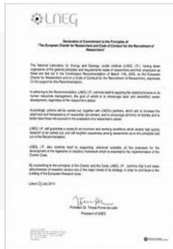
C&C Accession 28/Jul/2010